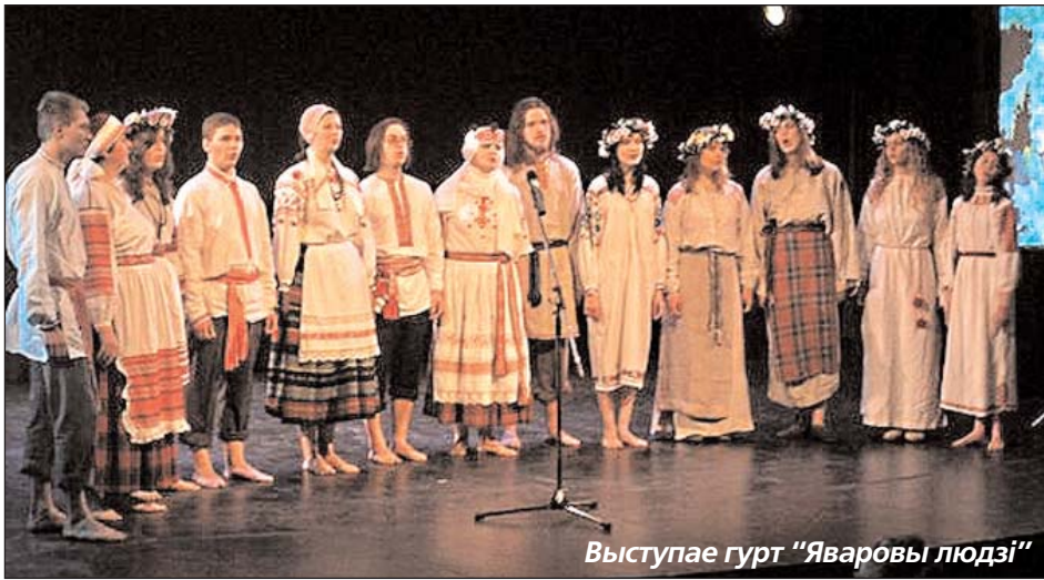
Выступае гурт “Яваровы людзі”