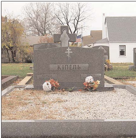
Магіла Яўхіма і Марыі Кіпеляў на беларускіх могілках у Саўт-Рывэры.

60 гадоў таму, 31 ліпеня 1949 г. , на сходзе беларускіх дзеячоў у Нью-Ёрку было створана Беларуска-Амэрыканскае Задзіно-