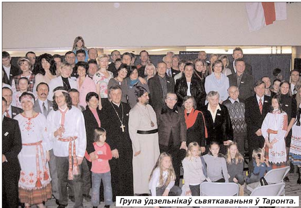
Група ўдзельнікаў святкаваньня ў Таронта.