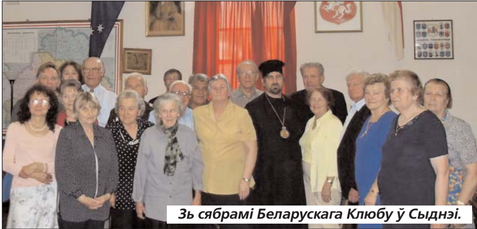
Зь сябрамі Беларускага Клубу ў Сыднэі.