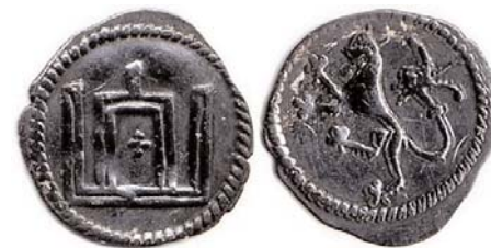
Пенязь смаленскі з Стаўпамі і лявом.

(1396-1399). Першыя смаленскія пенязі былі выкананыя на вельмі высокім мастацкім узроўні. На адным баку месцілася выява Стаўпоў – герба Вітаўта, на другім – два барсы, павернутыя ўправа (большы і меншы), над імі – лілея. Поруч з барсамі, на смаленскіх манэтах вядомы таксама матыў ільва ўлева, што стаіць на задніх лапах. Гэта вядомы зямельны герб Смаленшчыны.