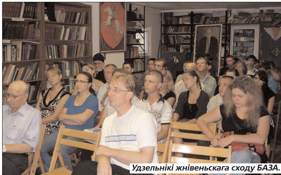
Удзельнікі жнівеньскага сходу БАЗА.