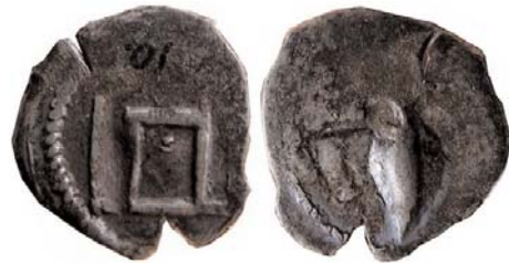
Пенязь Стаўпы/Грот дзіды з крыжам

Першымі манэтамі Вітаўта былі пенязі тыпу Стаўпы / Грот дзіды з крыжам. Гэтыя даволі распаўсюджаныя і даступныя цяпер маленькія манэткі біліся з раздушанага срэбнага дроту па тэхніцы, характэрнай для бальшыні ранніх манэтаў ВКЛ. Яны біліся з пачатку Вітаўтава валадарання прыкладна да 1401 году ў двух мынцах – Луцку і сталічнай Вільні.