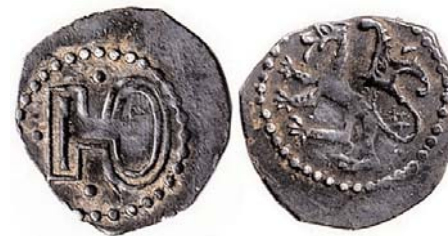
Пенязь смаленскі з літарай "Ю" і лявом

У 1401 годзе былі смаленскі князь Юры Святаславіч ізноў авалодаў месцам. Ён працягнуў біцьце манэты, карыстаючыся паслугамі таго самага мынцара. На яго манэце выяўленая кірылічная літара Ю і ўсё той-жа смаленскі леў.