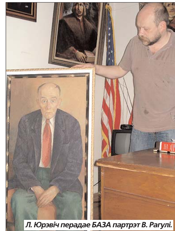
Л. Юрэвіч перадае БАЗА партрэт В. Рагулі.

Сп. Юрэвіч перадаў Фундацыі Крэчэўскага і БАЗА карціну, якую атрымаў ад сьв.пам. Барыса Рагулі. Гэта партрэт Васіля Рагулі, выбітнага грамадзкага і палітычнага дзеяча, які ў міжваенны час быў беларускім сэнатарам у польскім сэйме, а па вайне жыў у ЗША.