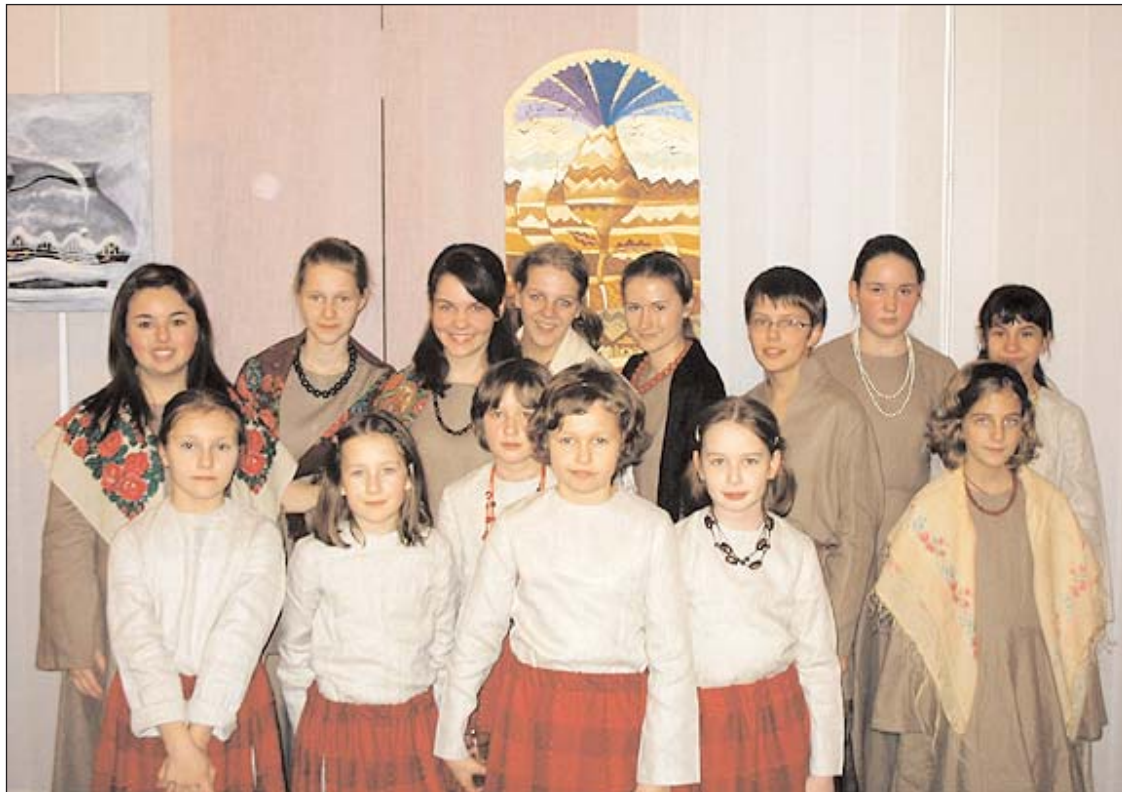
Юныя сьпявачкі студыі аўтэнтчнага беларускага фальклёру "Я нарадзіўся тут".

муж пайшла за чорныя бровы?..." Зноў дзявочы галасок, нібы тая свой сон апавядае, парапыняецца самотнымі дзявочымі галасамі, нібы коціцца няспыннае жыцьцёвае кола: